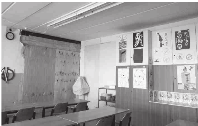
Foto: Klassenzimmer mit Durchbruch