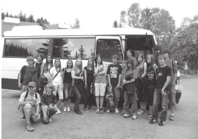
Foto: Gäste aus Mezibori mit Schülern der Mittelschule Sayda

Die tschechische Gruppe von 12 Jugendlichen und 2 Lehrern erfuhren zuerst etwas über unsere Schule und die Region. In einem kleinen Rundgang lernten sie unsere Mittelschule etwas kennen.