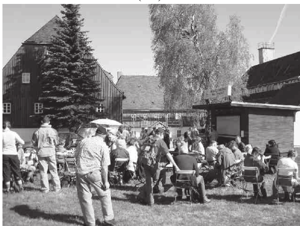
Foto: Sammeln der Wanderer am Gasthof Bad Einsiedel

Am Sonnabend, den 07. Mai 2011, begaben sich bei schönstem Wetter Wanderfreunde aus Nah und Fern mit schnellem Schritt auf die ca. 22 km lange Route über den Erzgebirgskamm in unsere Partnerstadt Mezibori (CZ).