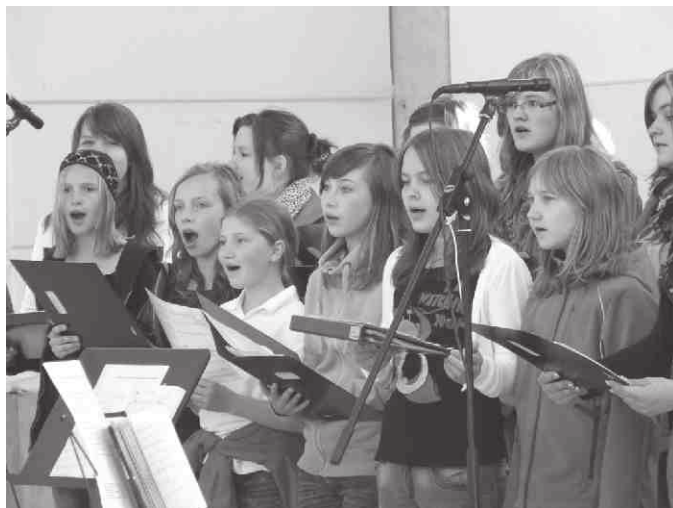
Foto: Der Chor der Mittelschule